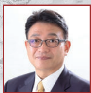
清元 秀泰 姫路市市長