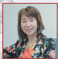
玉岡 かおる 作家